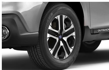
17" легкосплавные диски