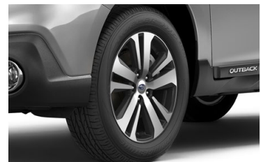
18" легкосплавные диски**