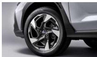
18-дюймовые колеса из алюминиевого сплава

1. Указанные цены являются максимальными ценами перепродажи и наличие опций, указанные в комплектациях могут изменяться без предварительного уведомления, так как сведения о ценах и комплектациях носят исключительно информационный характер. Вышеуказанную информацию необходимо уточнять у официального дилера